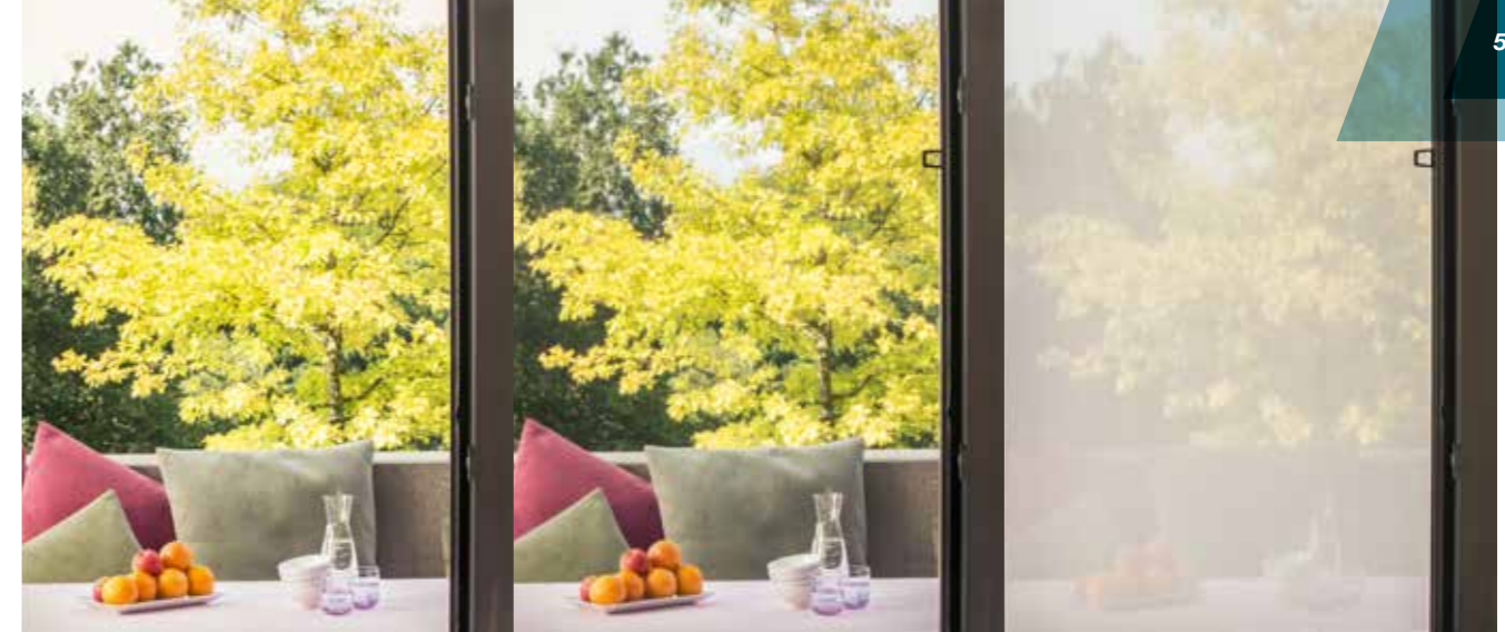
Sicht ohne Pollenschutzgitter