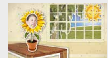
Und die Pollen auch.