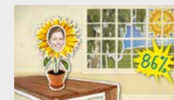
Und filtert 86% der Pollen.