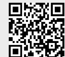
Hier geht's zum Film.