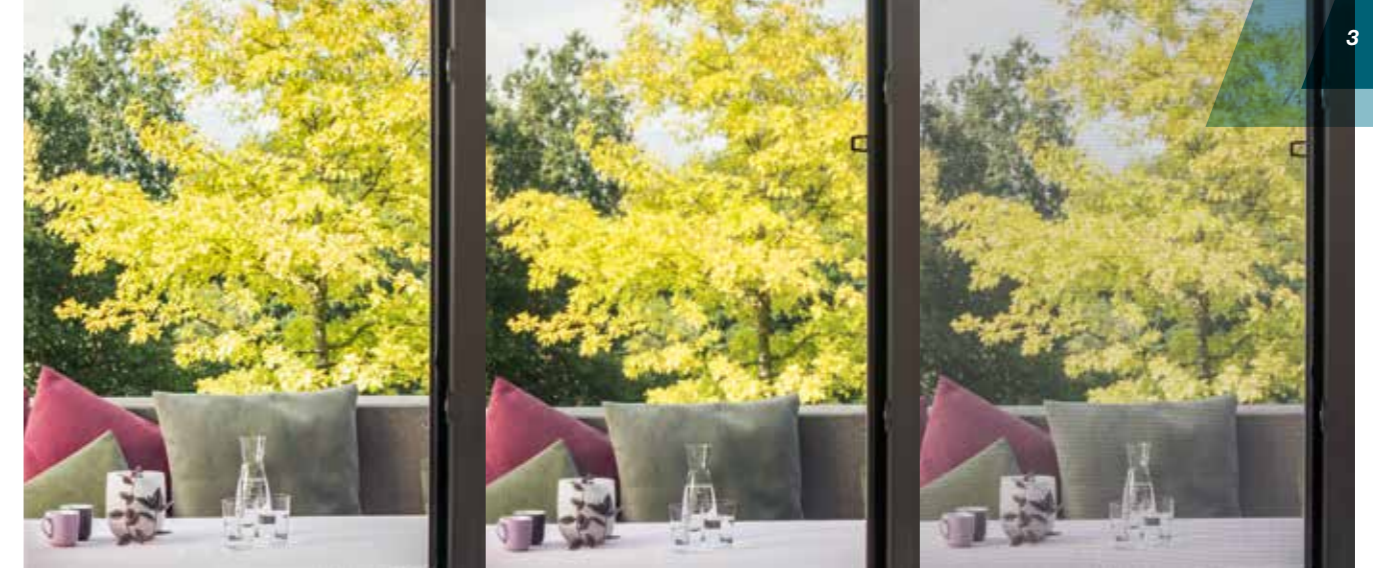
Sicht ohne Insektenschutzgewebe